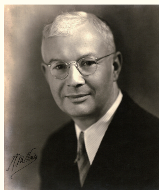
W. M. ヴォーリス