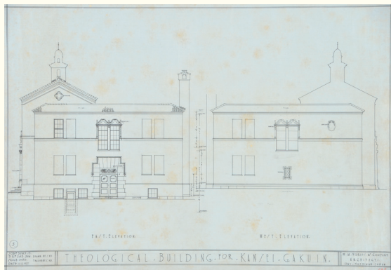
神学部校舎東・西立面図 1927年