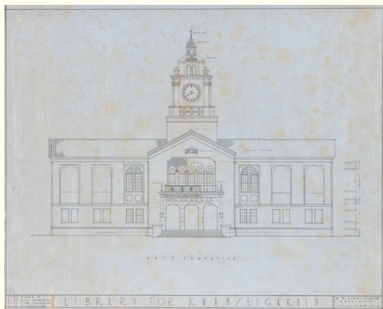
図書館(時計台)東立面図 1927年